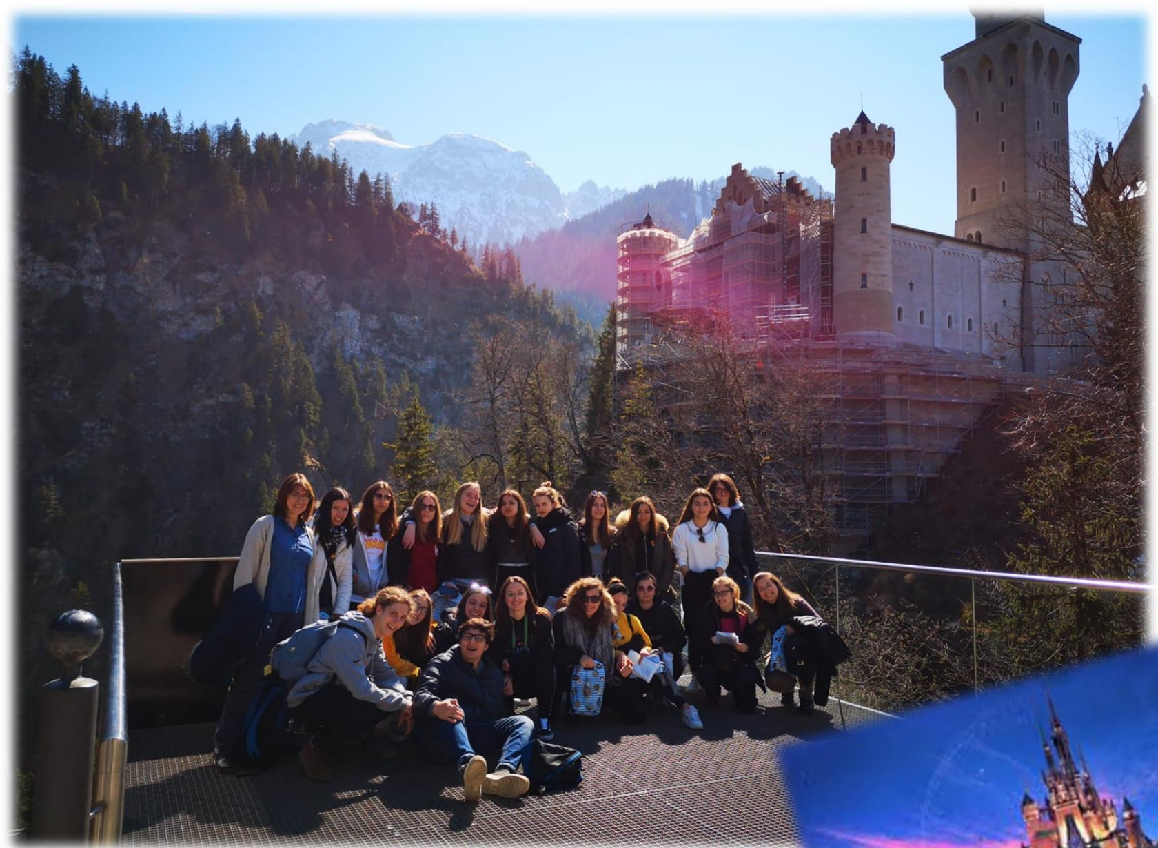
Castello di Neuschwanstein